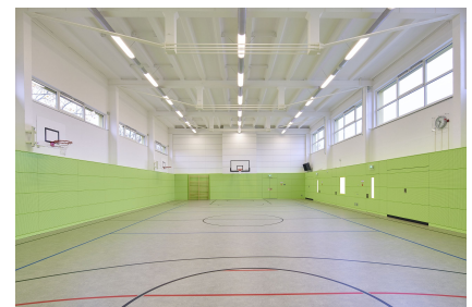
Die sanierte Sporthalle der Mozart-Gemeinschaftsschule, Foto: André Baschlawow