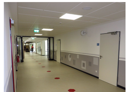
Überall gibt es breite Türen. Die Farbgestaltung bietet gute Orientierungsmöglichkeiten