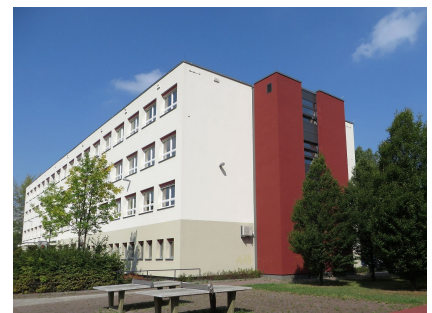
Ein Aufzug wurde an den Giebel gesetzt. Die Schule ist Vorreiter bei der Inklusion