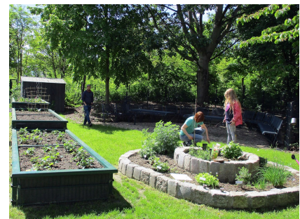
2018: Der Garten wächst und gedeiht