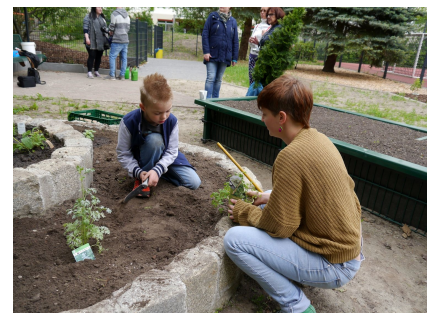
Für die Kräuterspirale ist der Jugendclub Betonia verantwortlich