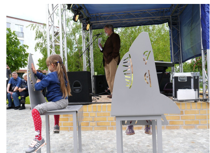
Die Motive der individuellen Sitzmöbel erinnern an Kurt Weills Werke