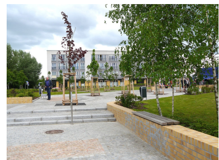
Eine gepflasterte Fläche und viele neue Bäume auf dem Platz