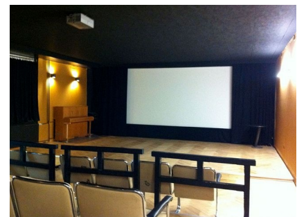
Der Kinosaal mit schallschluckender Decke und Wänden