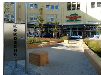
Stele für den Maler Oskar Kokoschka