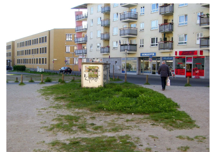
Der Platz vor Baubeginn