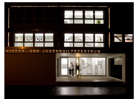
Das Kinder- und Jugendhilfezentrum mit eindrucksvoller Ausstrahlung