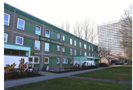
Das Kinder-, Jugend- und Familienzentrum vor der Fassadensanierung