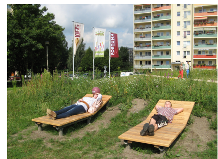
Auch Platz zum Ausruhen ist reichlich vorhanden

Quelle: FORTUNA Wohnungsunternehmen eG, Bearbeitung u. Fotos: Anka Stahl Stand: September 2013