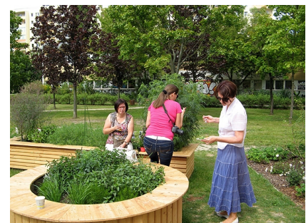
Hier darf gekostet werden - ein Kräuterhochbeet