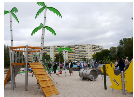
Für die kleineren gibt es den Sandspielbereich "Wüste und Steppe"