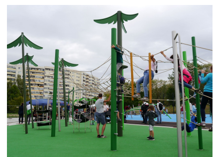
Der Kletterwald für die Sechs- bis Zwölfjährigen