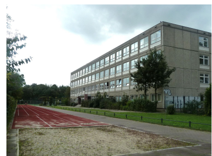
Die Schule vor Beginn des Ausbaus