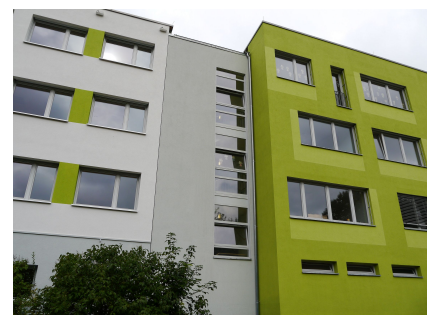
Die Fuge zum Erweiterungsbau (August 2014)

Ausweich-Pavillons 2012 bis 2013, Sanierung Hauptgebäude 2013 bis 2014