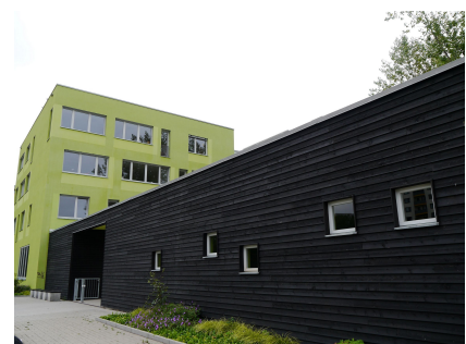
Blick auf den Gang mit den Pavillons

Stand: August 2015