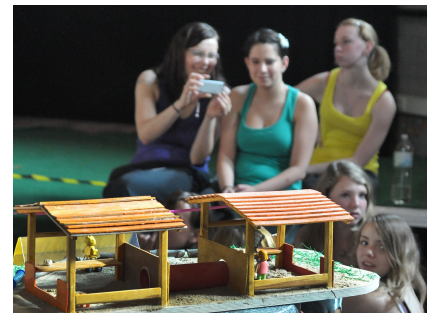
Sorgfältig erarbeitete Modelle waren im Wettbewerb oft wichtig