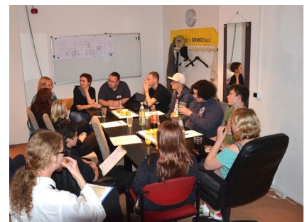
Jurysitzung. Jedes Teilnehmende Projekt entsandte jeweils ein Mitglied