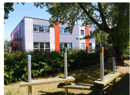
Neue Balancierstrecke oder Sitzbank, je nach Bedarf