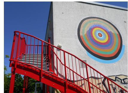
Der 2. Fluchtweg wurde 2008 angebracht