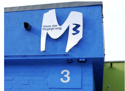
Identitätsbildend wirkt das Logo an der Fassade