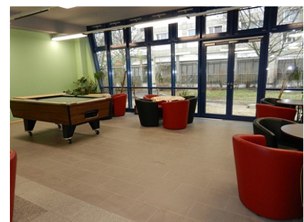
Das Café des M3 mit großer Fensterfront

Quelle: Bezirksamt Marzahn-Hellersdorf, Bearbeitung u. Fotos: Anka Stahl, Foto 3: M3 e.V. Stand: Februar 2016