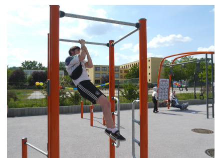
Geschicklichkeit und Kraft können sportbetont oder spielerisch trainiert werden