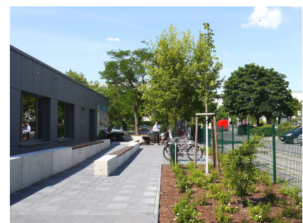
Der Eingangsbereich mit Sitzstufen und neu gepflanztem Bäumen