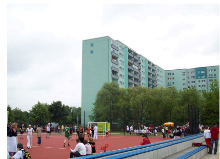
Die Sportflächen wurden 2009 eingeweiht