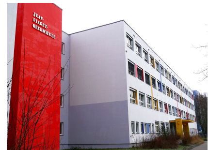
Rückseite mit Namenszug