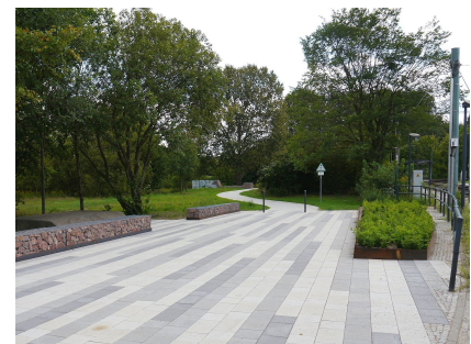
Der nördliche Zugang zum Wiesenpark an der Landsberger Allee