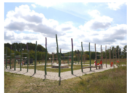
Der Spielplatz Wiesentraum

Quelle: Gruppe F, Bezirksamt Marzahn-Hellersdorf, Bearbeitung u. Fotos: Anka Stahl Stand: April 2024