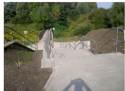
Die neue Treppe vom Kummerower Ring ins Wuhletal