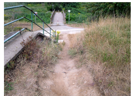
Zustand vor Beginn der Stadtumbau-Maßnahme