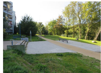
Der erneuerte Weg zwischen Wuhletal und Wohngebiet