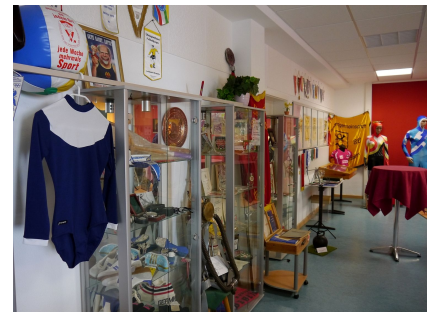
Im Sportmuseum im Erdgeschoss