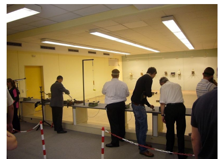
Die Trainingsanlage für Sport-Schützen