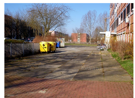
Der rückwärtige Schulhof vor Projektbeginn