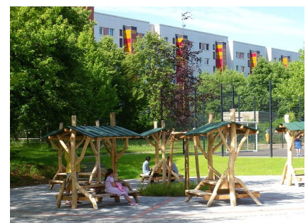
Die neuen Sitzplätze der Cafeteria

2004 (Sportflächen) u. 2012 (Südwestlicher Hof)