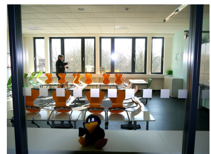
Klassenraum mit Sichtfenster zum Flur