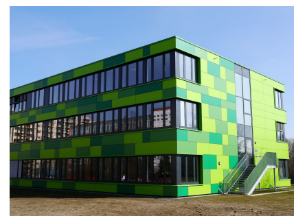
Der fertige Ergänzungsbau