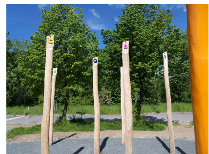
Ein Buchstabenwald als Slalomstrecke hilft spielerisch beim Lernen