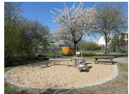
Der neue Wasserspielplatz