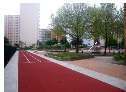
Leichtathletikanlagen und der Schulhof für die Größeren