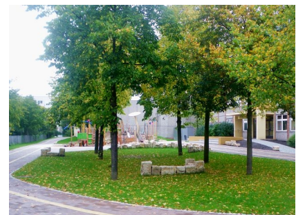
Neben dem Spielbereich gibt es viel Grün auf dem Schulhof für die Jüngsten