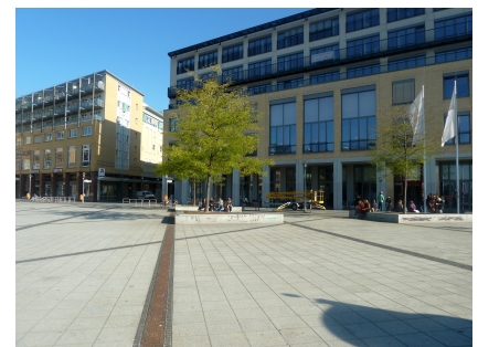
Blick über den Alice-Salomon-Platz auf die gleichnamige Hochschule