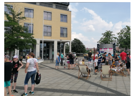
Ein Ort für Begegnungen und Feste