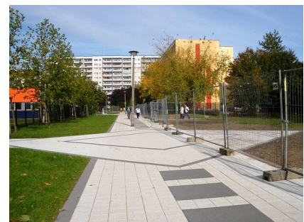
Die neue Verbindung zwischen den Schulbauten