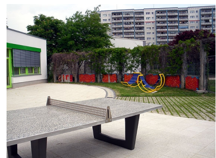
Die Mensaterrasse mit Spiel- und Sportgeräten