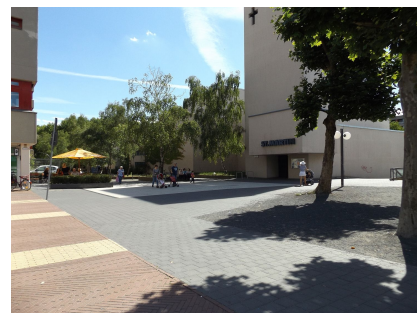
Der Vorplatz der Kirche St. Martin am Marktplatz