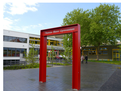
Auch Zugangsbereiche vor dem Thomas-Mann-Gymnasium und dem Bürgeramt wurden erneuert