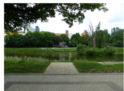
Blick vom Kreuzungspunkt an der Bettina-von-Arnim-Schule über das Mittelfeldbecken in Richtung Märkisches Zentrum