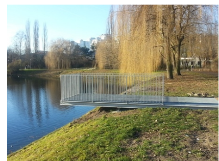
Der Steg verhilft zu neuen Perspektiven