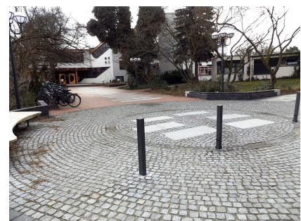
Eingangssituation der Jugendkunstschule Atrium am westlichen Zugang zum Mittelfeld