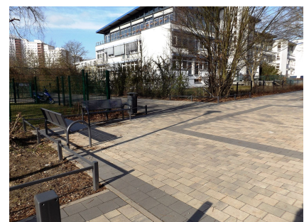
Aufenthaltsplatz am erneuerten Nordzugang zwischen Seniorenzentrum, Oberschule und Mittelfeldbecken