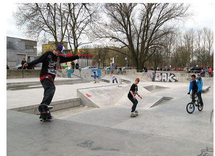
Beliebte Elemente des alten Platzes am Fontane-Haus, wie Geländer, wurden integriert