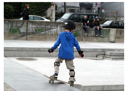
Die Anlage hat unterschiedliche Schwierigkeitsstufen