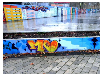
Motiv von ONE LOVE CREW