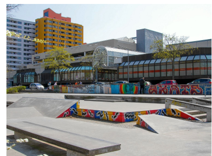
Der Skater-Park wurde mit Graffiti gestaltet