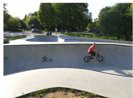
Die neuen Betonrinnen stellen hohe Anforderungen an das Können der FahrerInnen