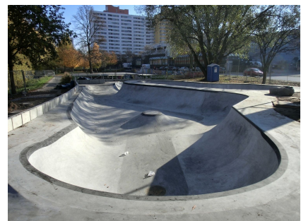
Auch die Erweiterung wurde mit den Nutzenden abgestimmt