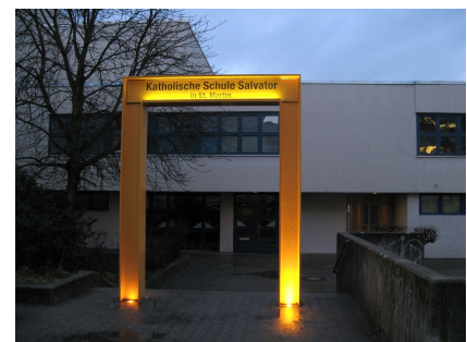
Auch in der Dunkelheit bilden die Tore markante Zeichen