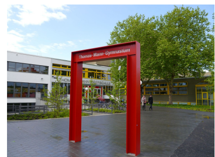
Eingangstor der Thomas-Mann-Oberschule