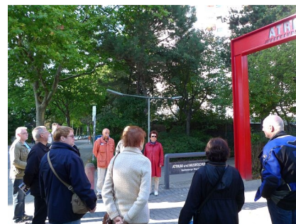
Der Quartiersbeirat besichtigt regelmäßig die laufenden Projekte