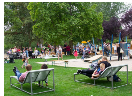
Liegemöbel neben dem Kleinkinderspielplatz