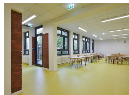
Die Mensa wurde großzügig erweitert