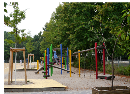
Neu gepflanzte Bäume mit Holzdecks