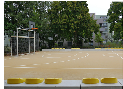
Neuer Bolzplatz mit Sitzplätzen zum Zuschauen