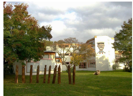
Der Kunstpark 2014