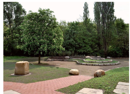
Ein Ort zum Flanieren und Entspannen mit viel Platz für Werke junger Künstlerinnen und Künstler