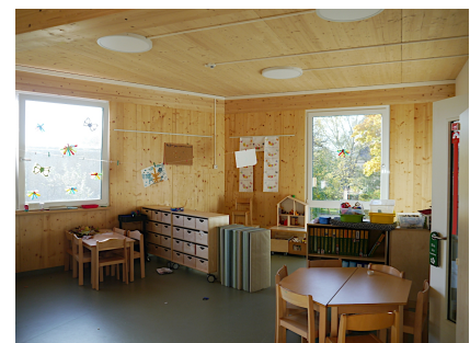
Die unverkleideten Wände veranschaulichen die Bauweise