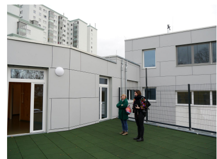
Auf dem neuen Obergeschoss in Holzbauweise können zwei Dachterrassen genutzt werden