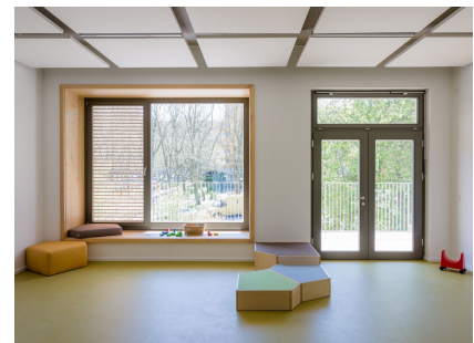
Helle Materialien und große Glasflächen sorgen für viel natürliches Licht.