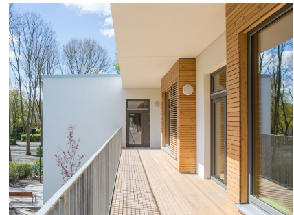
Auf der Gartenseite können die Gruppen einen umlaufenden Balkon nutzen.