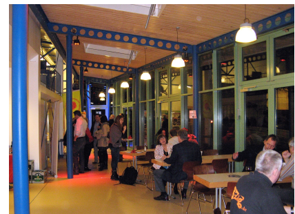
Im neuen Veranstaltungsraum