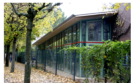
Die erweiterte Kinder- und Jugendhalle