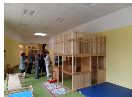
Ein helles, warmes und energieeffizientes Haus für die Kinder