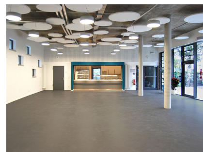
Die großzügige Mensa