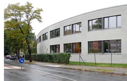
Der Erweiterungsbau am Dannenwalder Weg