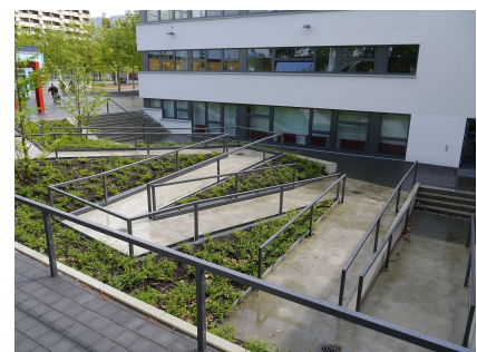
Der separate Eingang zum Bürgeramt im Souterrain