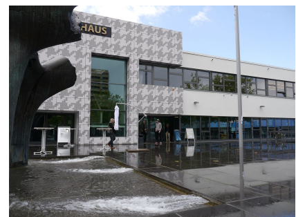
Blick über den Brunnen auf das neue Eingangsportale