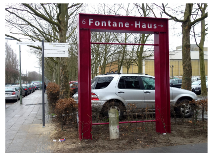
Das neue symbolische Eingangstor zum Fontanehaus stärkt dessen Präsenz in der Öffentlichkeit