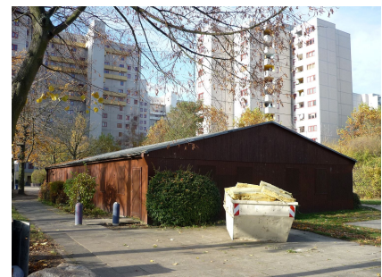
Das Gebäude vor Beginn der energetischen Sanierung