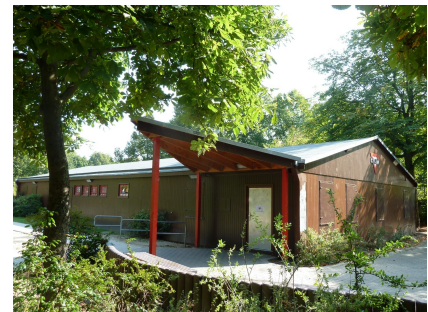
Das CVJM-Jugendhaus mit neuen Türen und Vordach