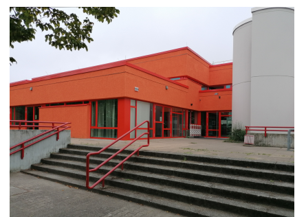
Das comX nach der Sanierung im neuen Farbton