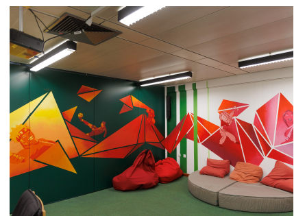
Den Kinoraum gestalteten die Jugendlichen mit.