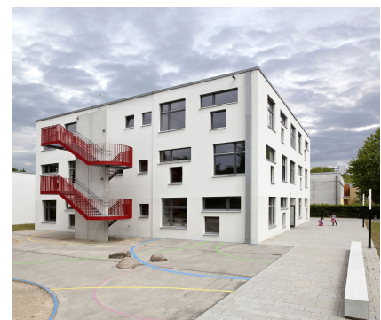
Erweiterungsbau mit angrenzenden Spielflächen