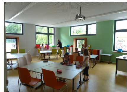
Lichte Klassenräume in moderner Farbgebung fördern den Spaß am Lernen